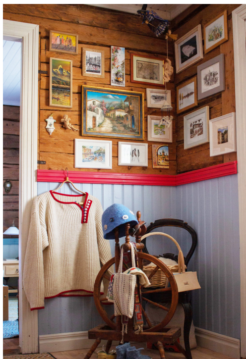
Interjööris on läbivaks jooneks lambrii ning ajastuomased puitprofiilid, palju on näha palkseinu