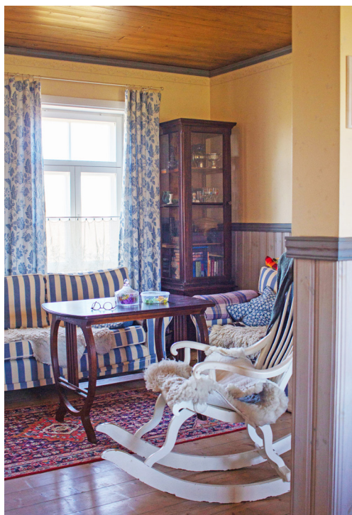
Köök-elutuba, kus saab tule paistel kiiktoolis hubast ja südamega kujundatud elamist nautida