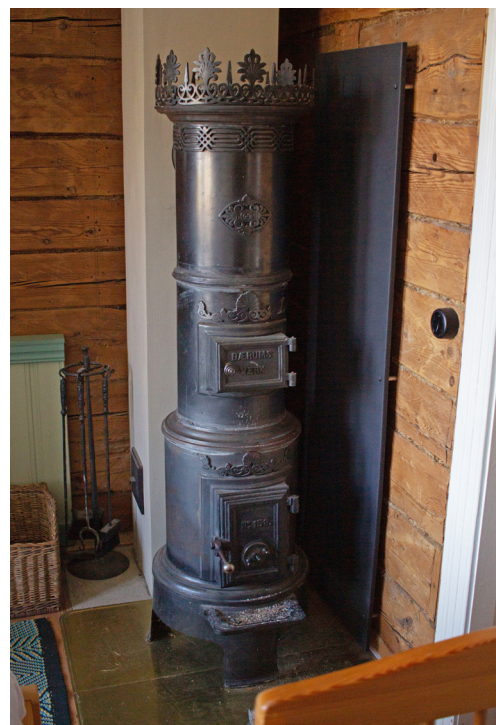
19. sajandi lõpust pärit Norra malmahi teeb toa kiirelt soojaks

Maja tagafassaadi ilmestab vintskapp – peremees kahtlustab, et päris algselt seda seal polnudki. Eelmine vintskapp oli maja jaoks liiga lai ning katusevahetusega sai see kitsamaks ehitatud. Majal on traditsiooniliselt 6-ruudulised kaheraamsed käsitööna valminud puitpakettaknad, verandade akende jaotus on tüüpiliselt rikkalikum.