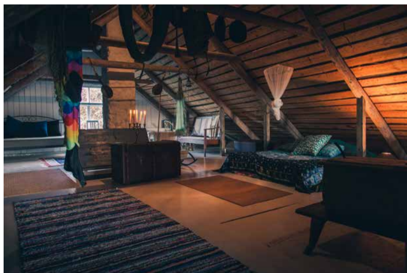
Avatud põõning on mõnus suur ruum suviseks kasutuseks.

muudatusi teha. Aga praegu sobib kõik selliselt nagu on.