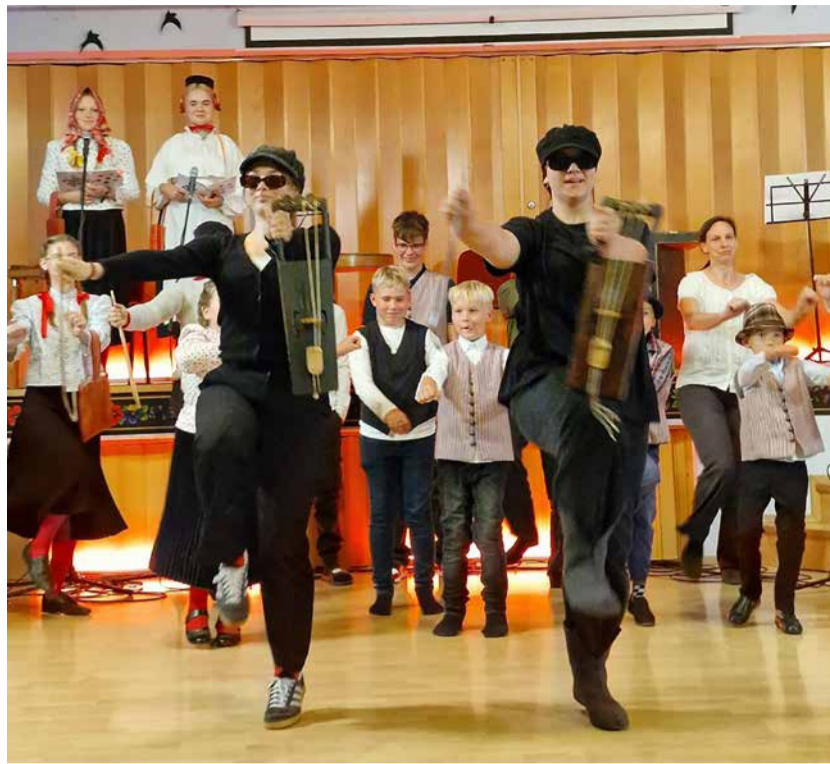
Vormsi noorte etteaste saarte noorte pärimuspäeval Muhus septembris.