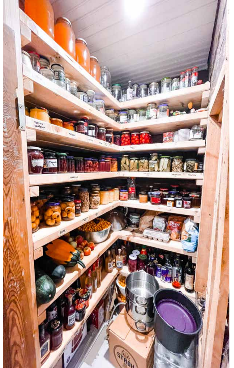
Sahver on täis endakasvatatud ja valmistatud toitu. Mitte ainult kriisivaru, vaid ka hea ja parem söök kogu perele.

Mulle meeldib, et eriolukorras on mu pere alati toiduga varustatud ning meil on olemas oskused neid varusid täiendada.