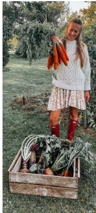
Loo autor Vormsi mullas kasvanud juurviljadega.

Oma talus kasvatame puuja köögivilja terveks aastaks, samuti on oluline vahva kanakari või kalastamisoksus. See tähendab, et me sööme palju hooajalist toitu. Tegelikult ei pea me igal aastaajal näiteks saama värsket kurki süüa. Meie keha tänab talvel meid koduse juurvilja eest palju rohkem kui välismaise toiteväärtuselt tühja kurgi või tomati eest. Mulle on just kodune hooajaline