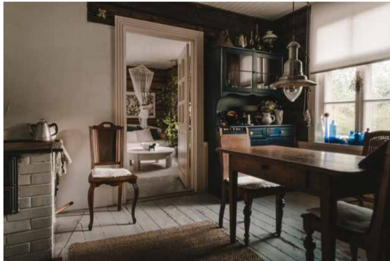
Heledad toonid loovad helge ja valgusküllase meeleolu. Mitme kihi papi alt tuli välja vana ja väärikas laiadest laudadest põrand.

Kui tulevikus oleks soov saarel alaliselt elada, siis oleks vaja ehk