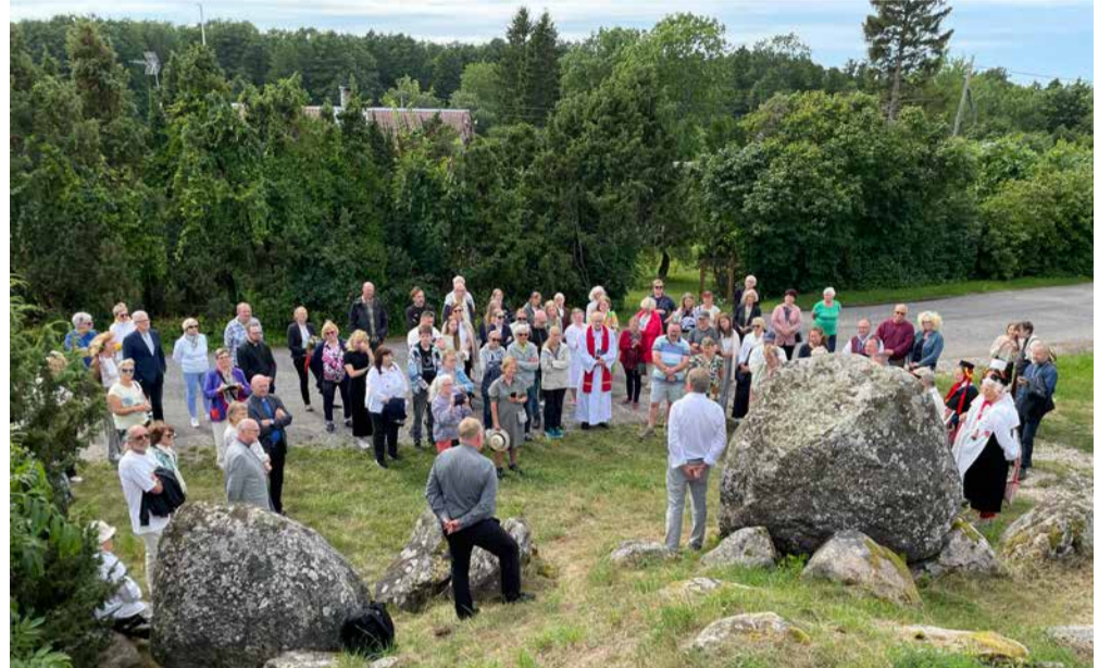
Olavipäevalised Sviby mäe juures mälestustahvli taasavamisel. Sviby pole tükk aega näinud ligi saja inimese jalutamist läbi küla.