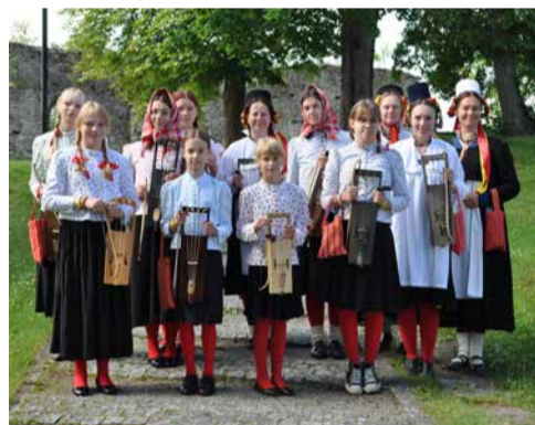
Vormsi talharpajad eestirootsi laulupeol 6. juuli 2024.