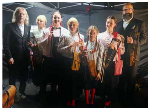
Puuluup ja Vormsi noored Viljandi folgil.

Suvi lõppes meie kõigi jaoks hiiu kandle laagriga Vormsl, kus sel korral oli osalejaid ja õpetajaid kokku rekordiliselt viiskümmend. Toimusid õpitoad, vaba lava, õpetaja Ilkka Heinoneni kontsert, matk, meie enda laagrikontsert ja sellele järgnenud tantsuõhtu. Ning muidugi palju pillimängu!