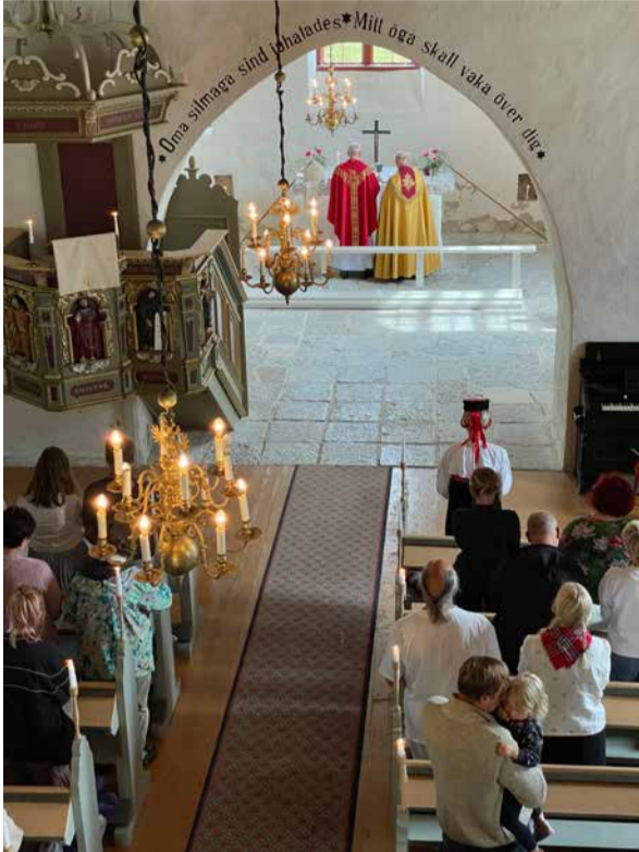
Olavipäeva tähistamise keskpunkt on jumalateenistus Püha Olavi kirikus ja supisöömine kirikuaias.