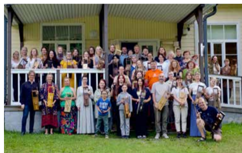
Talharpa laagri ühispilt Vormsi rahvamaja ees.