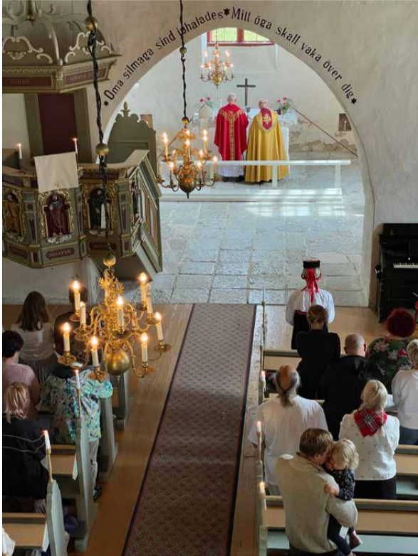
Olavipäeva tähistamise keskpunkt on jumalateenistus Püha Olavi kirikus ja supisöömine kirikuaias.