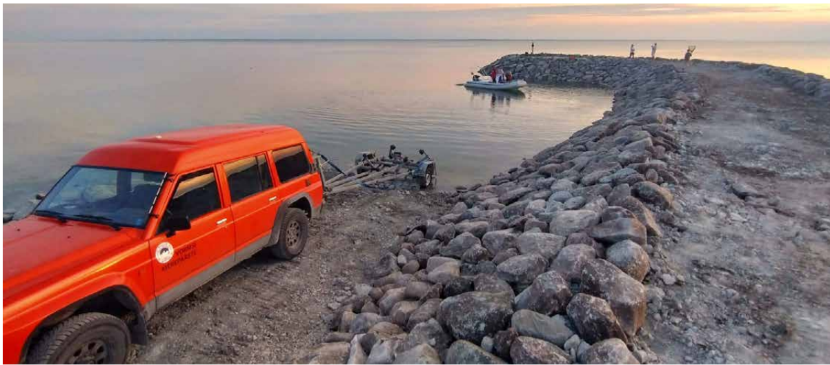
Saxbys saab taas merele minna. Veeskamiskohta kaitseb muul.