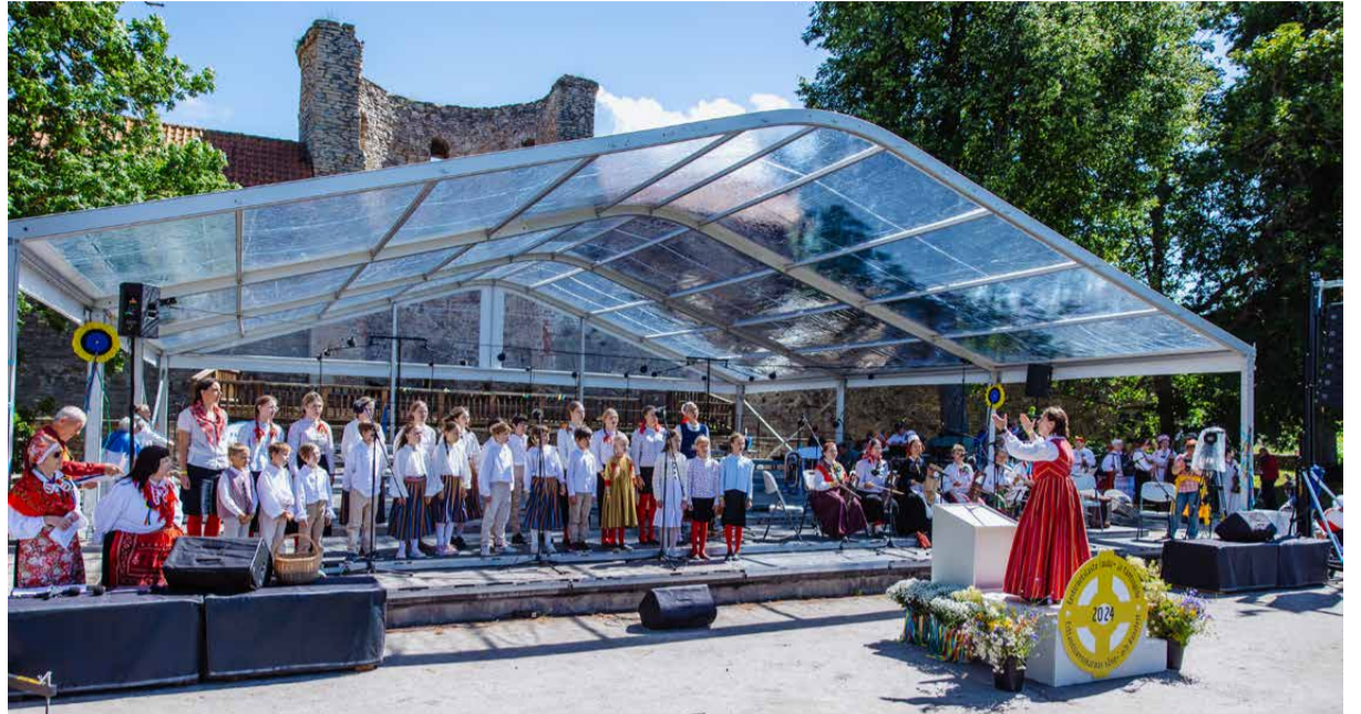
Vormsi lapsed esitasid suvel eestirootslaste laulupeol Haapsalus koos Stockholmi mudilaskooriga Vormsi ja Riguldi kandist pärit laule.

Väikeses kogukonnas ja koolis on iga inimene oluline. See, kui võrd väärtustatuna ja toetatuna õpilane end tunneb, on kooli valikul üheks oluliseks võtmeküsimuseks. Selleks on uues õppekavas lahti kirjutatud käitumisviise, kuidas need väärtused peegelduvad Vormsi koolipere enda igapäevastes tegemistes: