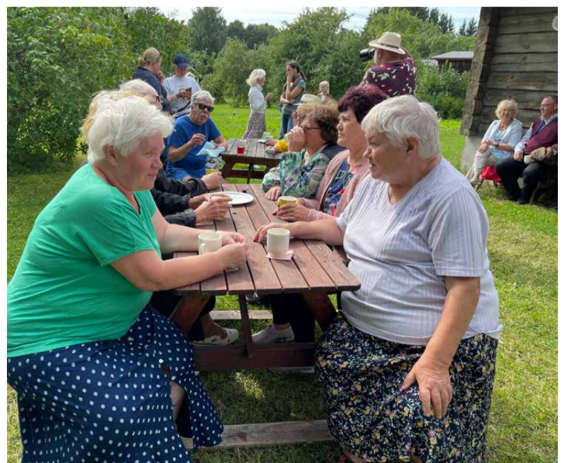
All: Vormsi talumuuseumis said kokku vormsilased siit- ja sealtpoolt merd. Joodi kohvi, söödi saiakesi ja kuulati laulu ning talharpa helisid.