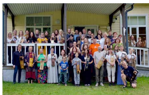
Talharpa laagri ühisfoto Vormsi rahvamaja ees.