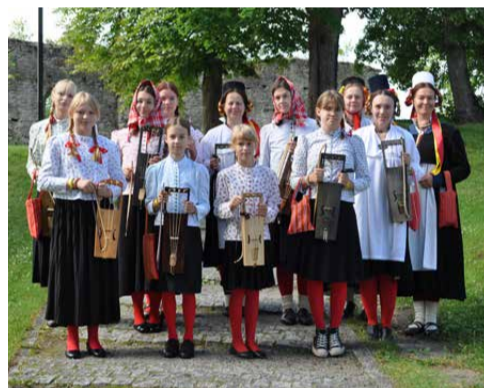
Vormsi talharpajad eestirootsi laulupeol 6. juuli 2024.