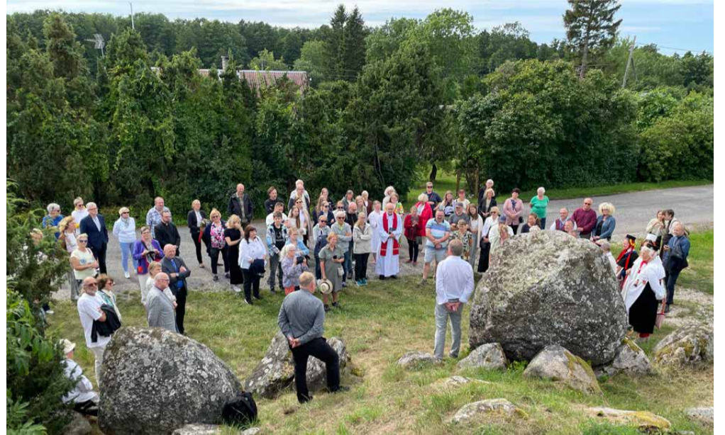
Olavipäevalised Sviby mäe juures mälestustahvli taasavamisel. Sviby pole tükk aega näinud ligi saja inimese jalutamist läbi küla.