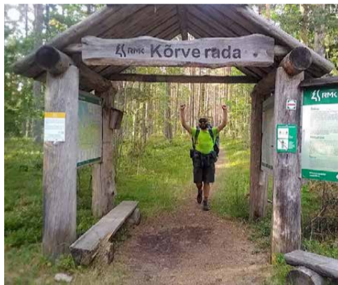
Rändan siin, seal, matkakepp käes... Olgeri matkad aastatel 2021 ja 2022 ning kitarriga 2024.

Üks öö õnnestus tal ööbida Mart Saare muuseumi majutuses linade vahel.