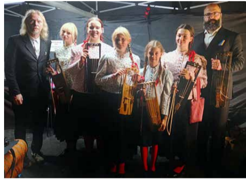
Puuluup ja Vormsi noored Viljandi folgil.

Suvi lõppes meie kõigi jaoks hiiu kandle laagriga Vormsl, kus sel korral oli osalejaid ja õpetajaid kokku rekordiliselt viiskümmend. Toimusid õpitoad, vaba lava, õpetaja Ilkka Heinoneni kontsert, matk, meie enda laagrikontsert ja sellele järgnenud tantsuõhtu. Ning muidugi palju pillimängu!