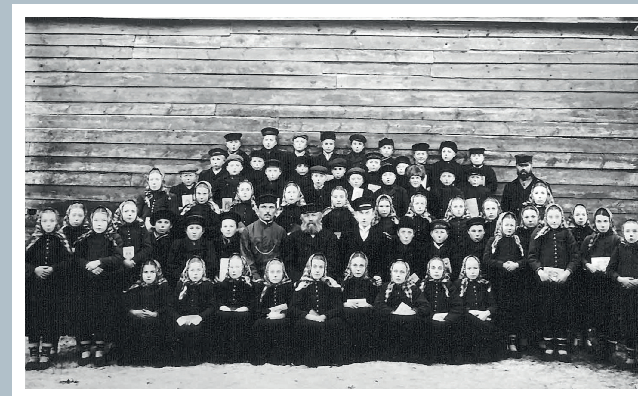
Borrby kooli õpilased 1914-1918.