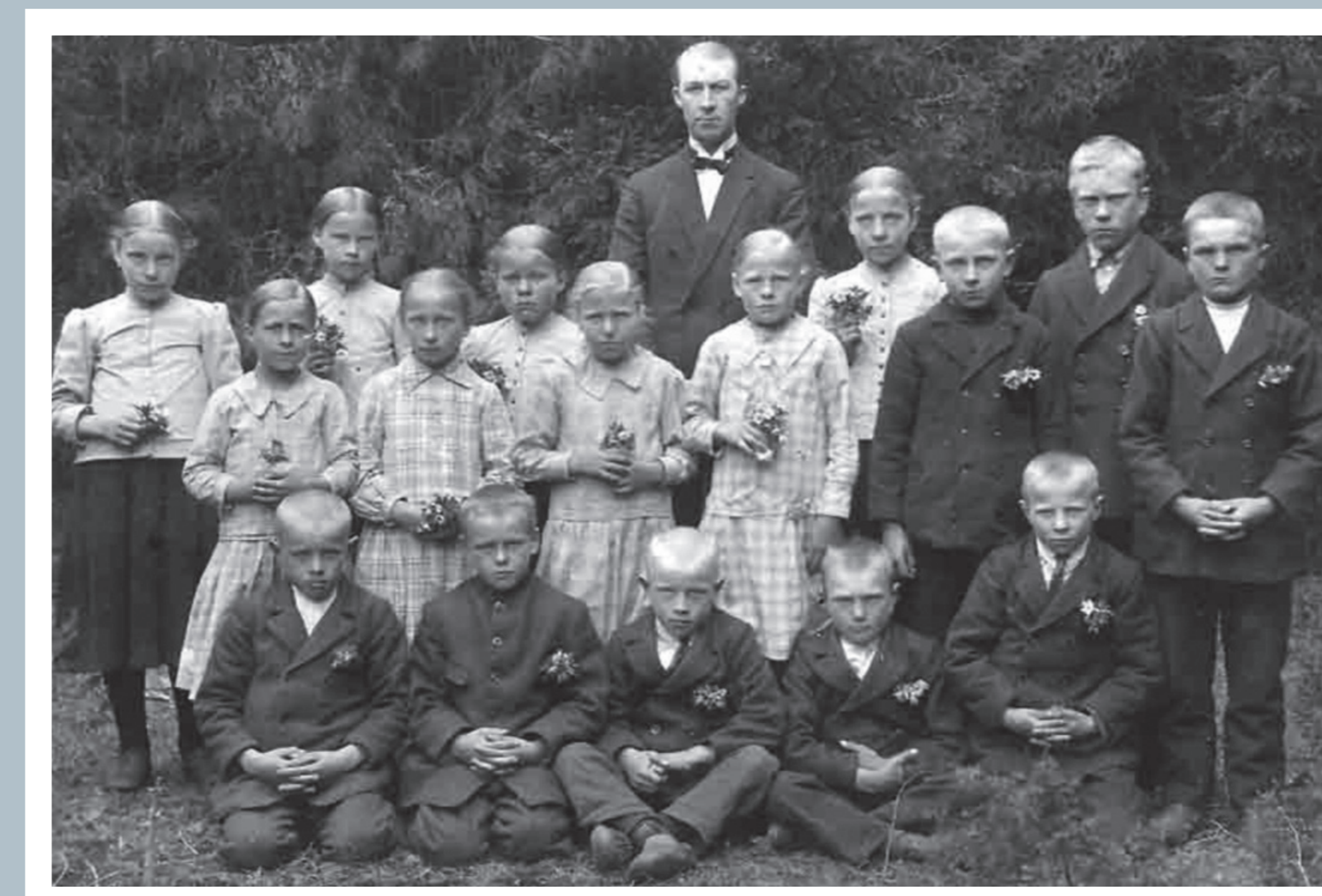
Borrby kooli lõpetajad 1931.