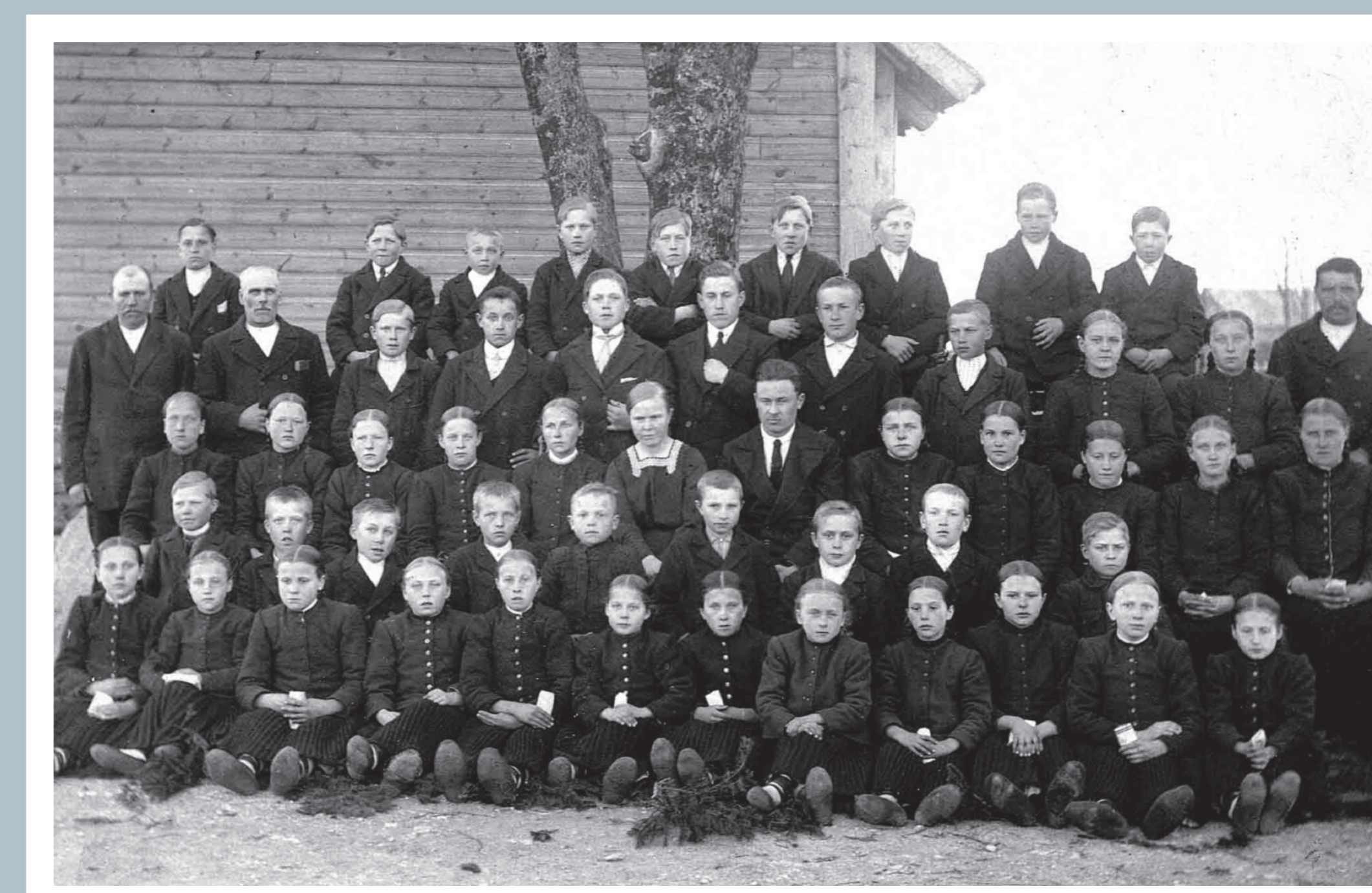
Borrby kooli õpilased 1922.