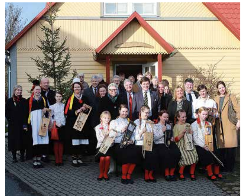
Vormsi lapsed koos Rootsi parlamendi spiikriga.