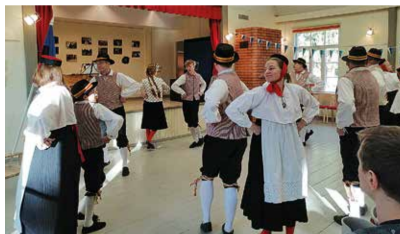
Vormsi rahvatantsijad.

Uunikumiklubi orienteerumise ürituse korraldamise eest Vormsil;