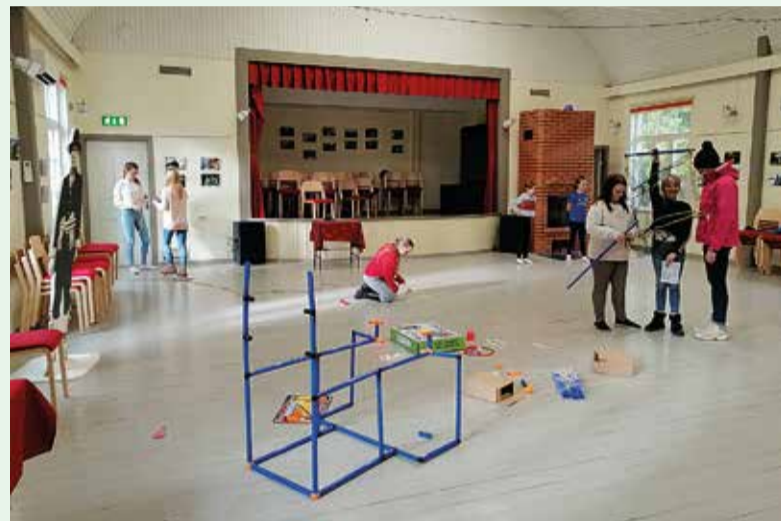
Vormsi noored tähistamas sünnipäeva.

Tänu eelmise aasta toetusele sai noortetuba komplekteeritud, tehtud mitmeid tegevusi ja noored said koha, kus muu seas ka oma sünni-