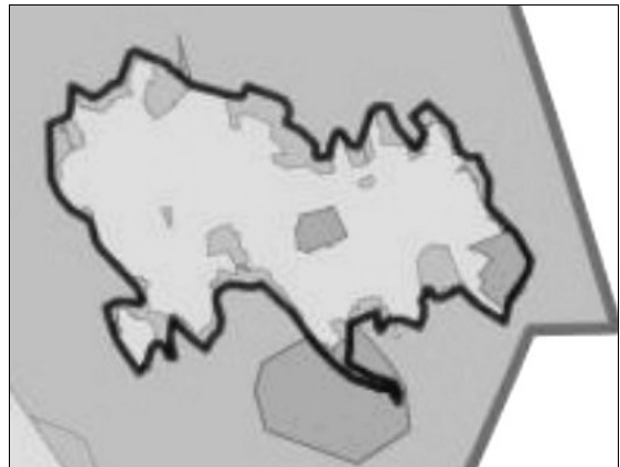
Joonis 1. Vormsi tsoneering (väljavõtte programmiala kaardist)