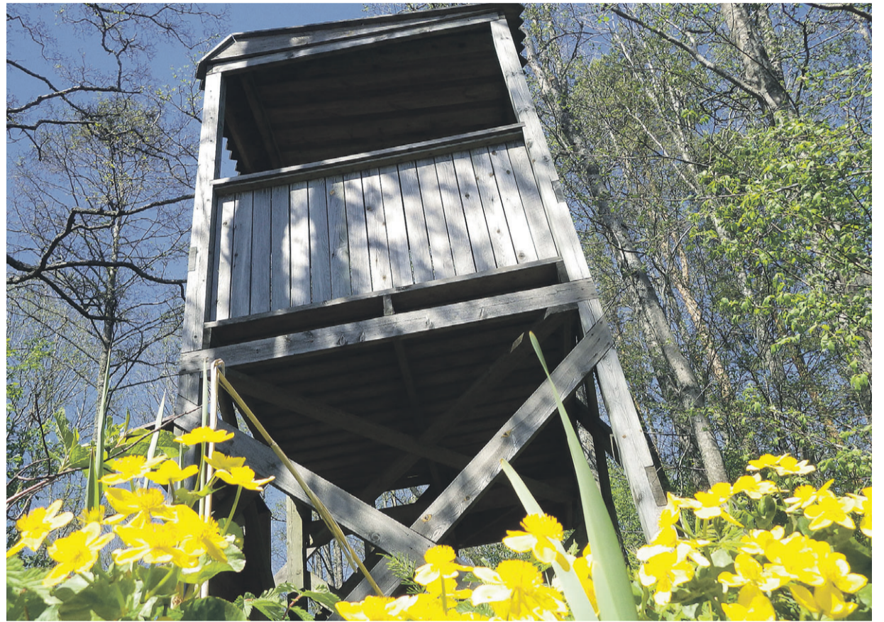
Linnuvaatlustorn matkarajal.

Eesti Loodushoiu Keskus rekonstrueeris matkaraja LIFE Springday projekti käigus EL LIFE programmi ja Keskkonnainvesteeringute keskuse toel. Vormsi allikad ei olnud projekti ainuke sihtmärk, tegeldi ka Kiigumõisa allikatega Järvemaal ja Viidumäe allikatega Saaremaal.