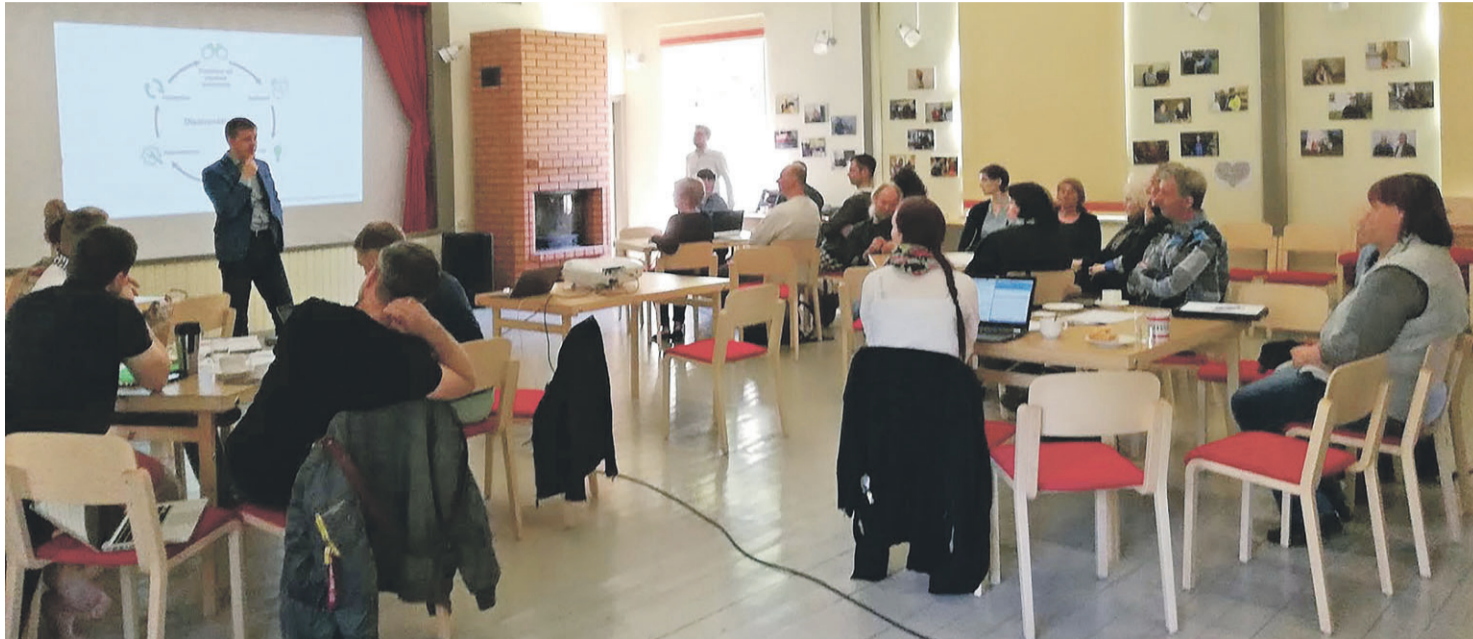
Strateegiapäeva arutelu rahvamajas.