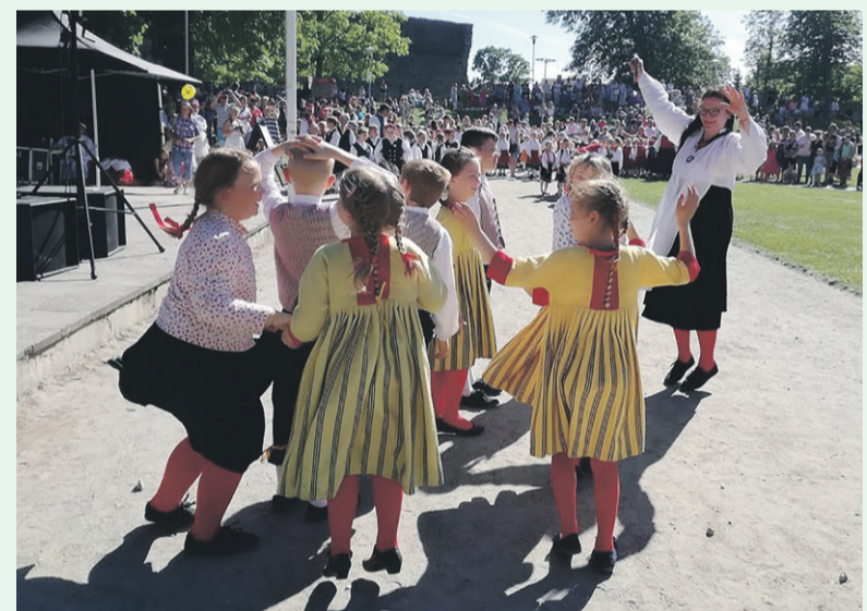
Kaunites rahvariietes Vormsi tantsurühm.

Täna Sind tantsija, lapsevanem, Vormsi kool, Vormsi vabatahtlik merepääste ja Vormsi vald! Tänu teie kõigi pingutustele ja abile sai taaskord teoks Vormsi laste Läänemaa tantsupeol osalemine.