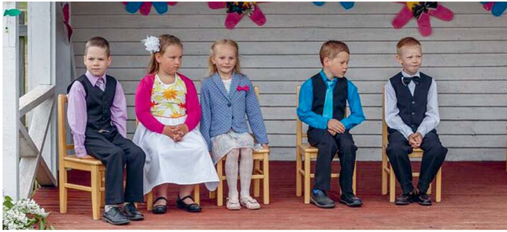
Päevakangelased.