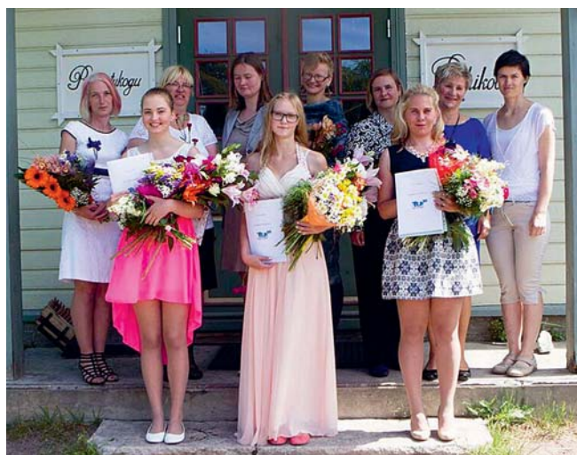
Rõõmsad ja õnnelikud lõpetajad.