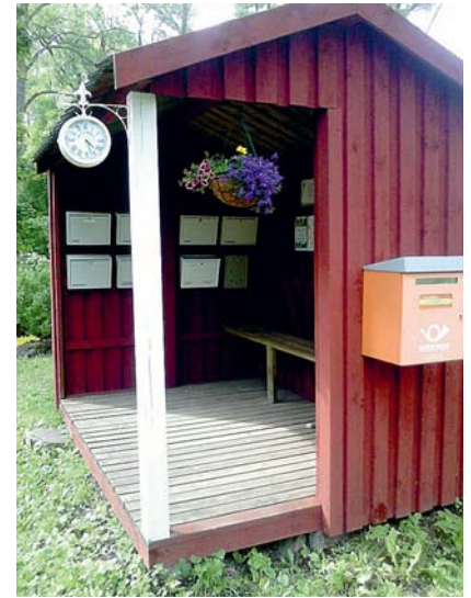
Kersletis on ilus.

Soovi korral oleme valmis korraldama edaspidigi vahvaid ühiseid ringsõite.