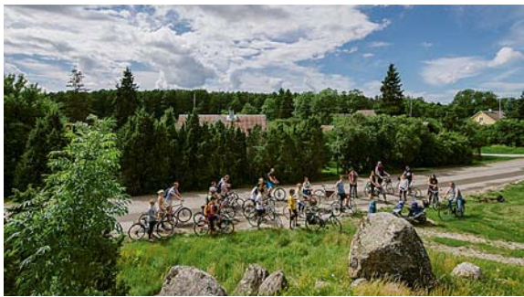
Tour d'ÖÖ ligi 30-pealine seltskond sõitis läbi nii läänekuulid idaringi. Peatuti olulisemate vaatamisväärsuste juures ja kuulati giidi põnevaid lugusid.