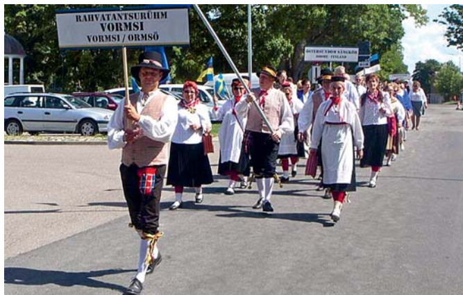
Pidulik rongkäik läbi linna