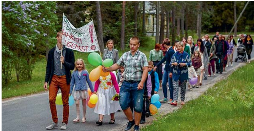
Meeleolukas rongkäik läbi Hullo

nadega lasteaeda ja andis üle lastelt kogutud mõttekillud, meenutused lasteaia kohta. Käsitööselt pidas lõpetajaid meele traditsiooniliste soojade kähikutega. Esinemiste lõpus pandi vette soovililled, istutati lasteaeda kaunis perepuu ning tantsiti ühine tants. Peo lõppu kaunistas imekaunis tort, mida õhinaga sööma hakati.