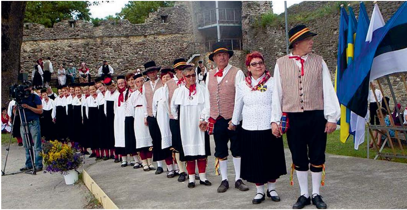
Tantsuks valmis!