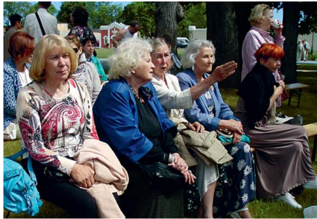
Pildile jäi kolmandik «reisilistid».