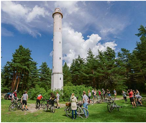
Ratturitele pakkusid põnevust eelkõige Vormsi majakad. Kokku läbiti saarel üle 40 kilomeetri külateid.

Nädalavahetusel kogunesid Vormsi saarele Tallinn Bicycle Weeki korraldajad ja fännid, kes pidasid saarel Tallinnas populaarseks saanud Tour d'ÖÖ suvepäevi. Ühiselt sõideti läbi saare külad, korraldati velofilmide õhtu Hullo rahvamajas ning pidu pubis Krog no 14. Refereeritud Läänlase artiklit.