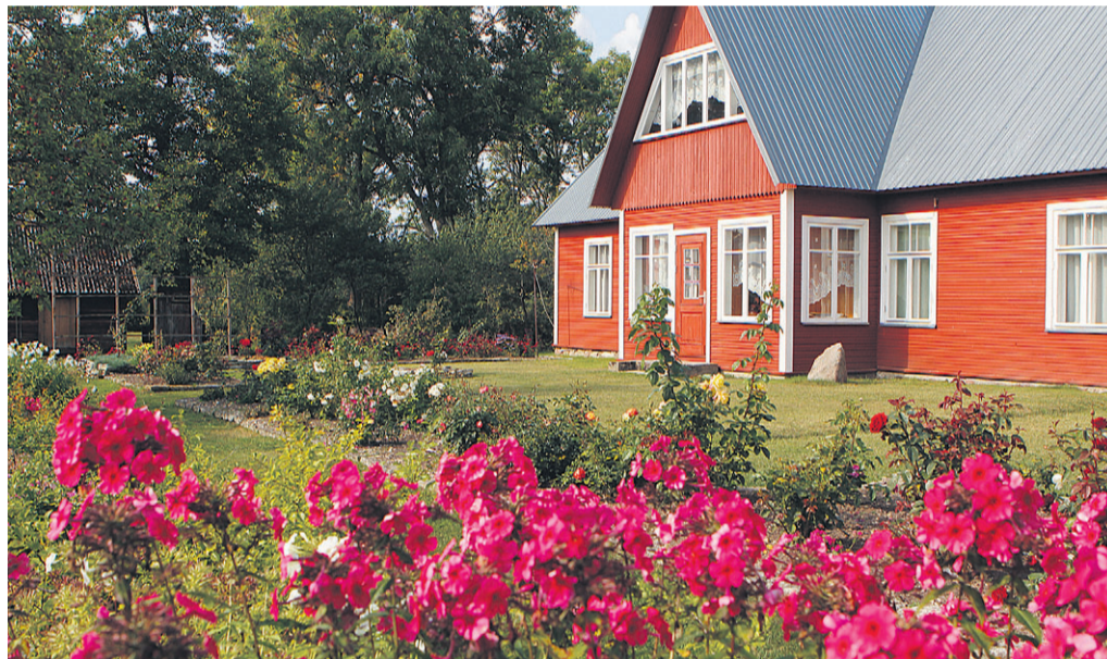
Elumaja lõõmavate floksidega

hoolikalt värvitud ja klaasitud uksega majake. Pakun, et külalistemajake, aga ei. Hoopis puukuur! Ja see aed... Korralikult pügatud muru, kõnniteed, nagu joonlaua järgi laotud paest peenraaäred, ikka veel õitsev ja piinlikult puhtaks rohitud