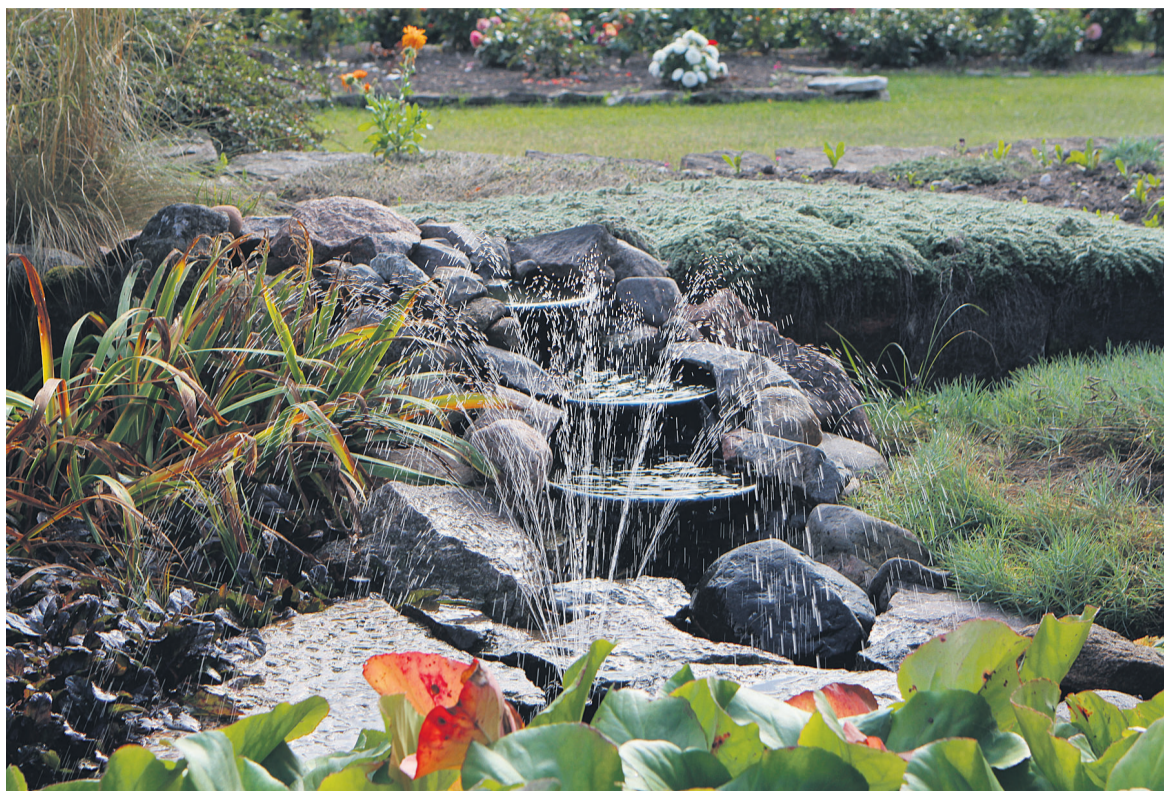
Siin käivad linnukesed pesemas.