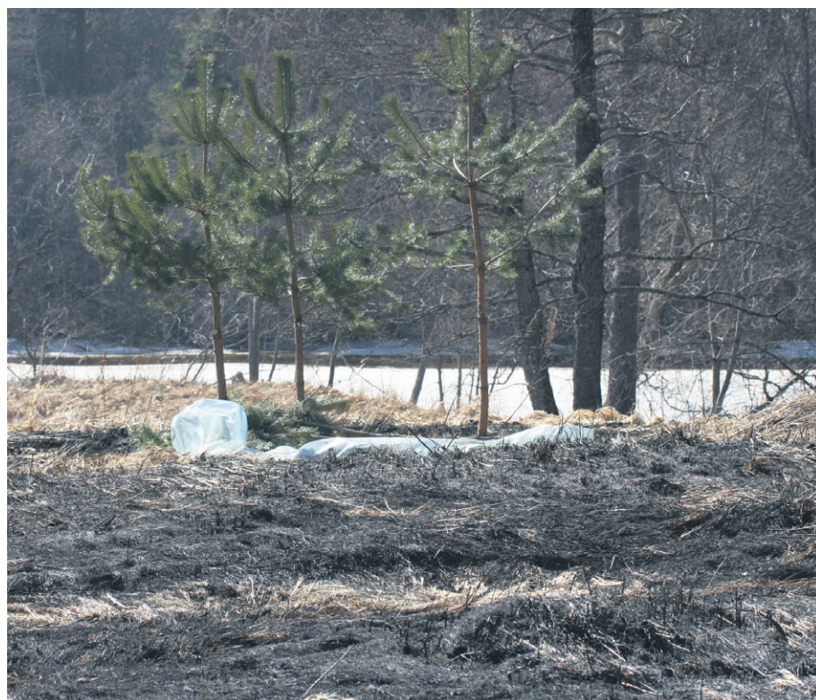
«Hooletus ees...».

Kui aga siiski on juhtunud elektriliini vigastamine, tuleb säilitada külm närv ja eemaldada õnnetuskohalt lühikeste sammudega jalgu üksteise vastu libistades neid teineteisest eemaldamata või jalad koos hüpates. Nii väldid elektrilöögi saamist eluohtlikust sammupingest. Õnnetuse korral tuleb sellest teavitada Elektrilevi rikketelefonil 1343, viga saanud inimeste korral aga helistada kiiresti häirekeskusesse 112.