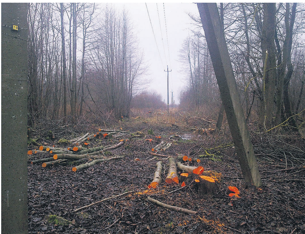
Puude langetamine elektriliinide juures.