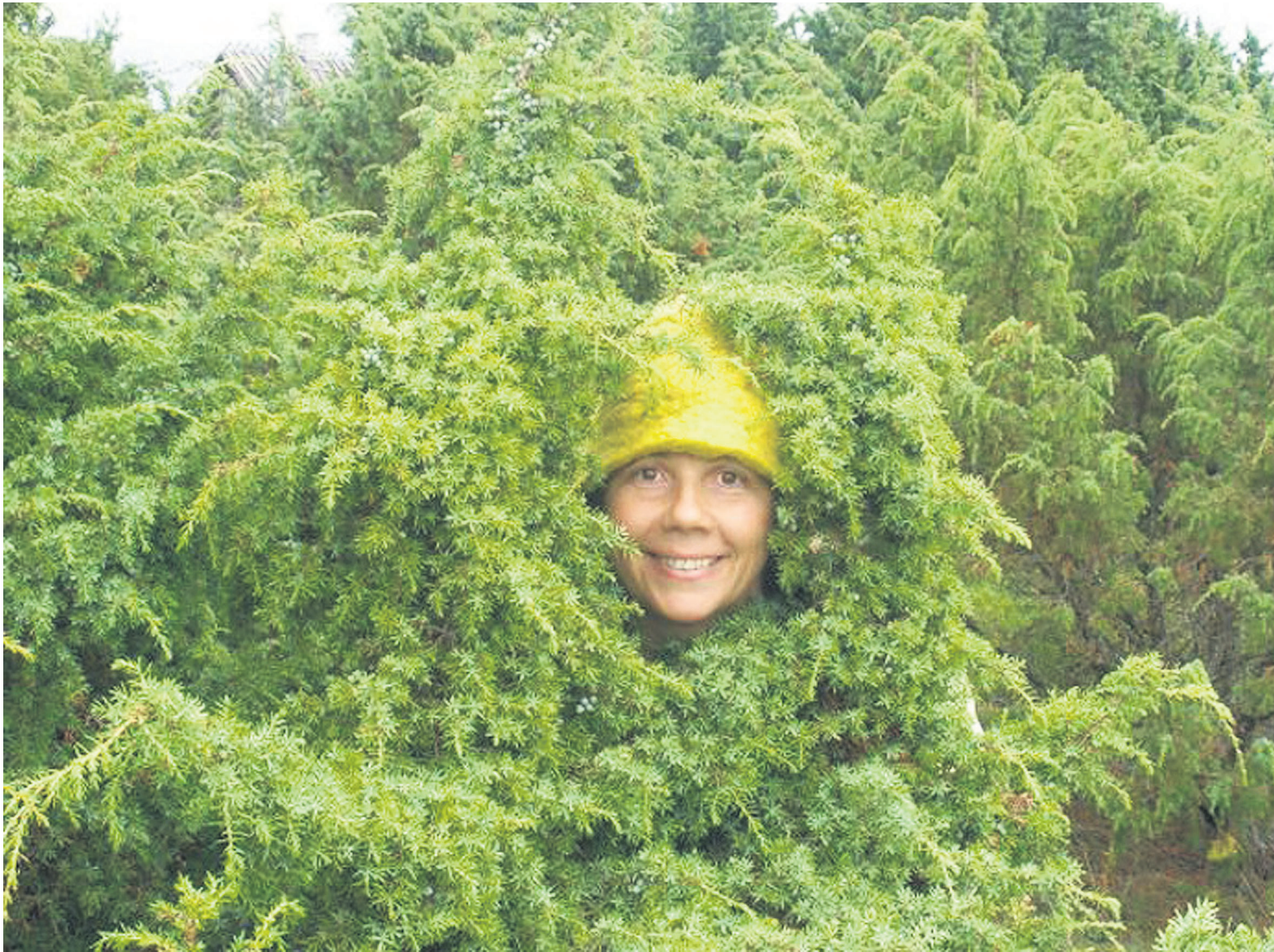
Võrumaa line-tantsija Rumpo kadakates. Fotokonkurss «Avasilmi Vormsi».