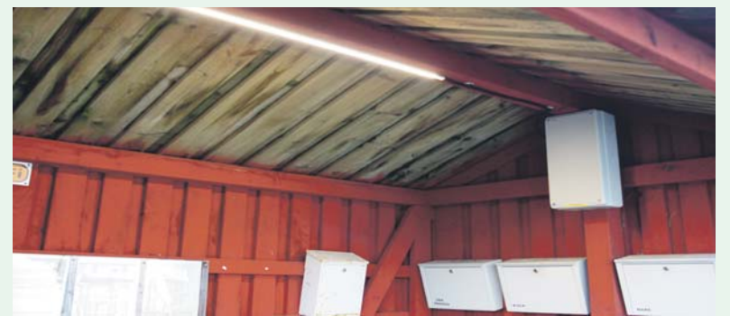
Valgustatud bussipeatus Suuremõisas.

Ootan ettepanekuid ja tähelepa- nekuid, kuidas praegune bussipea- tuste valgustamine toimib, kuidas selline lahendus meeldib, kas võiks midagi olla teisiti. Mõtted võib edastada otse allakirjutatule või vallavalitsusele e-posti aadressil vv@vormsi.ee. Projekti käigus loo- dud valgustuslahendus ei pea jääma ainult bussipeatuse ja prügimaju valgustama, vaid võib vajadusel leida kasutust igas majapidamises, kus on vajadus valgustada elektri- võrgust eemale jäävaid punkte või on soov osa (miks mitte ka kogu) majapidamise energiatarbimisest viia üle taastuval energiale. Päi- kesepaneel ja valgustid on lihtsasti paigaldatavad, et vajadusel kasuta- da ka nt lühiajaliselt. Kellel huvi, võib julgesti ühendust võtta, et koos leida vajalikud võimalused ja lahendused.