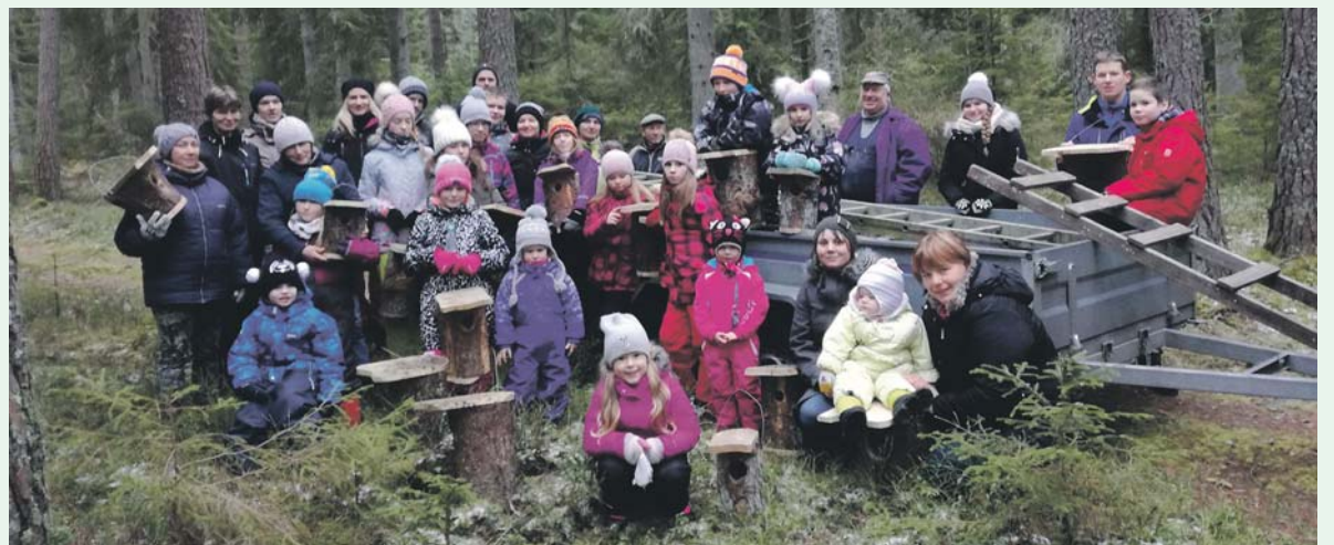
Vahva seltskond pesakastidega.

Täname lapsi ja lapsevanemaid, kes vahvast projektist aktiivselt osa võtsid!