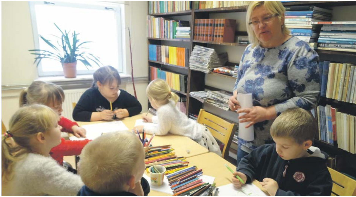
Ene muinasjutuhommikul.