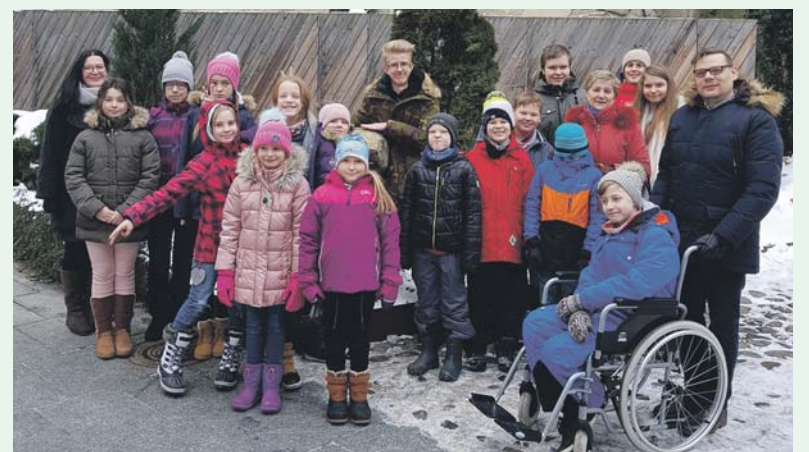
Kogu koolipere õppepäeval Tallinnas.

Muuseumi külustus oli põnev ja hariv. Täname KIKI ja kõiki, kes võimaldasid meile selle suurepära- se õppepäeva.