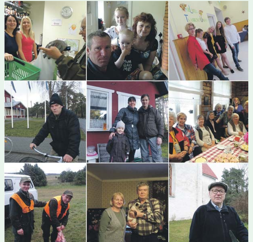
Kollaaž Vormsi inimestest.

tagavara täiendada, panna paberile enamusi Vormsi elanikke, ühes nende elamuvaatega; kinnisvara omanikke, suveelanikke- neid, kes meie saare elu originaalsete ideedega toetavad ja elluviivad.