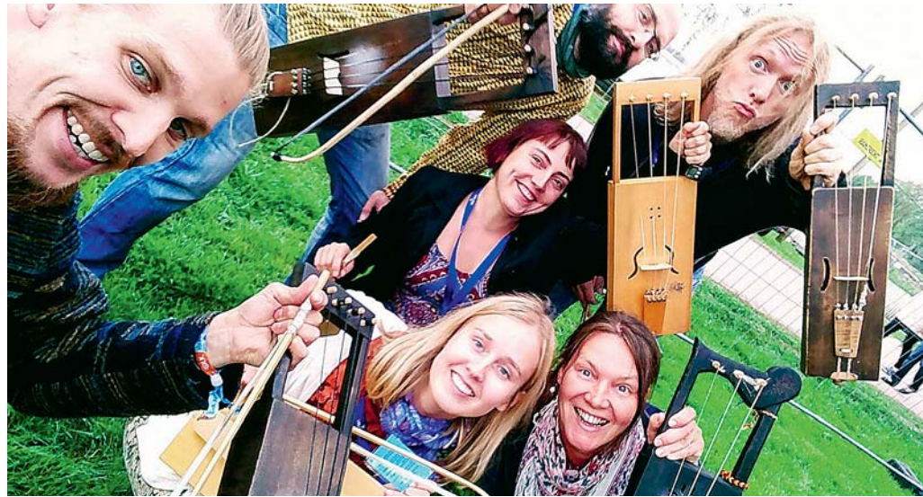
Talharpa camp 2017 korraldajad.

Lõpetuseks... nagu ütles Oskar Lutsu Kevades õpetaja Laur Tootsile – ...kui sa ei saa tervet ülesannet lahendatud, siis tee pool ülesandest... Püüame, siis pisut rohkem tähelepanu iseendale pühendada ja väärtustagem oma tervist.