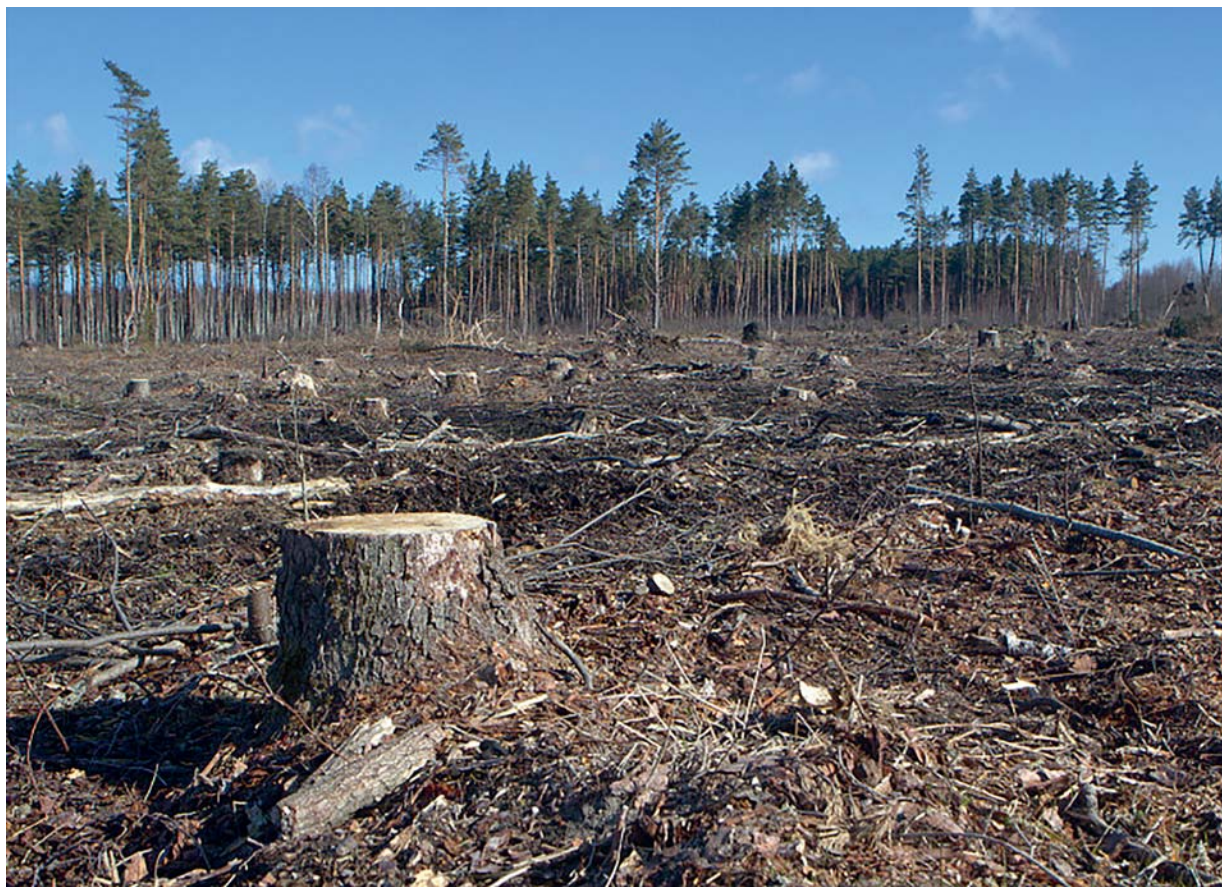
Lageraielandid – suurimate ja vastandlikemate arutelude põhjustajad.

Kui kehtiv seadus lubab loo- ja nõmmemetsades planeerida kuni 2 ha suurusi lageraielange, siis väikesaartel arvati see piirang kõikidele metsatüüpidele sobima. Kui rahvusvahelised vabatahtlikud metsasertifitseerimise standardid