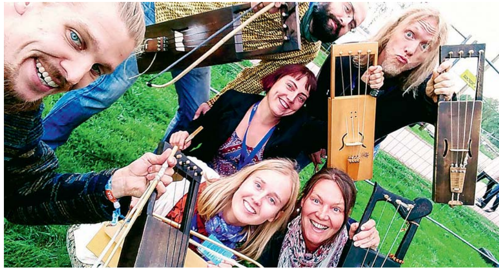
Talharpa camp 2017 korraldajad.

Lõpetuseks... nagu ütles Oskar Lutsu Kevades õpetaja Laur Tootsile – ...kui sa ei saa tervet ülesannet lahendatud, siis tee pool ülesandest... Püüame, siis pisut rohkem tähelepanu iseendale pühendada ja väärtustagem oma tervist.