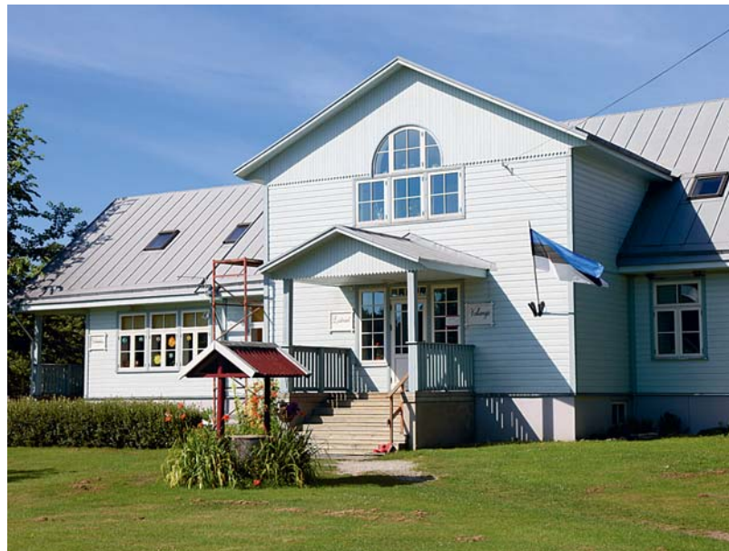
Praegune lasteaia maja