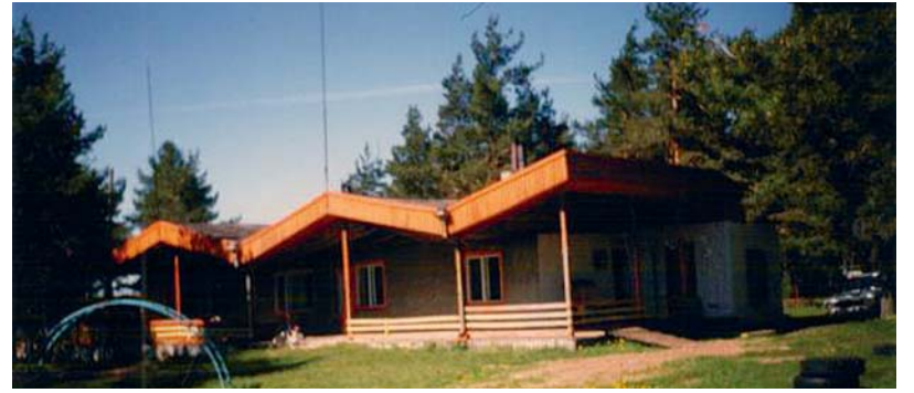
Vana vahva lasteaed.