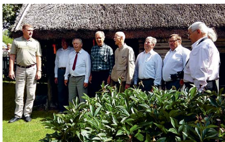
Tõrva Meesansambel talumuuseumi hoovis

Eduard ja Tõrva meesansambel 29. juulil, 2016