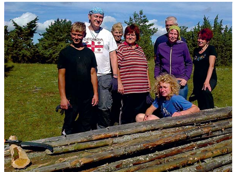
Tublid talgulised. Autor: Elle Palmpuu