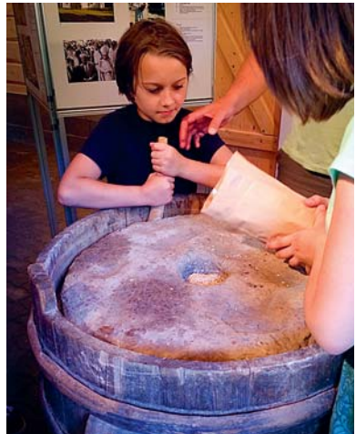
Küll see käsikivi on ikka raske!