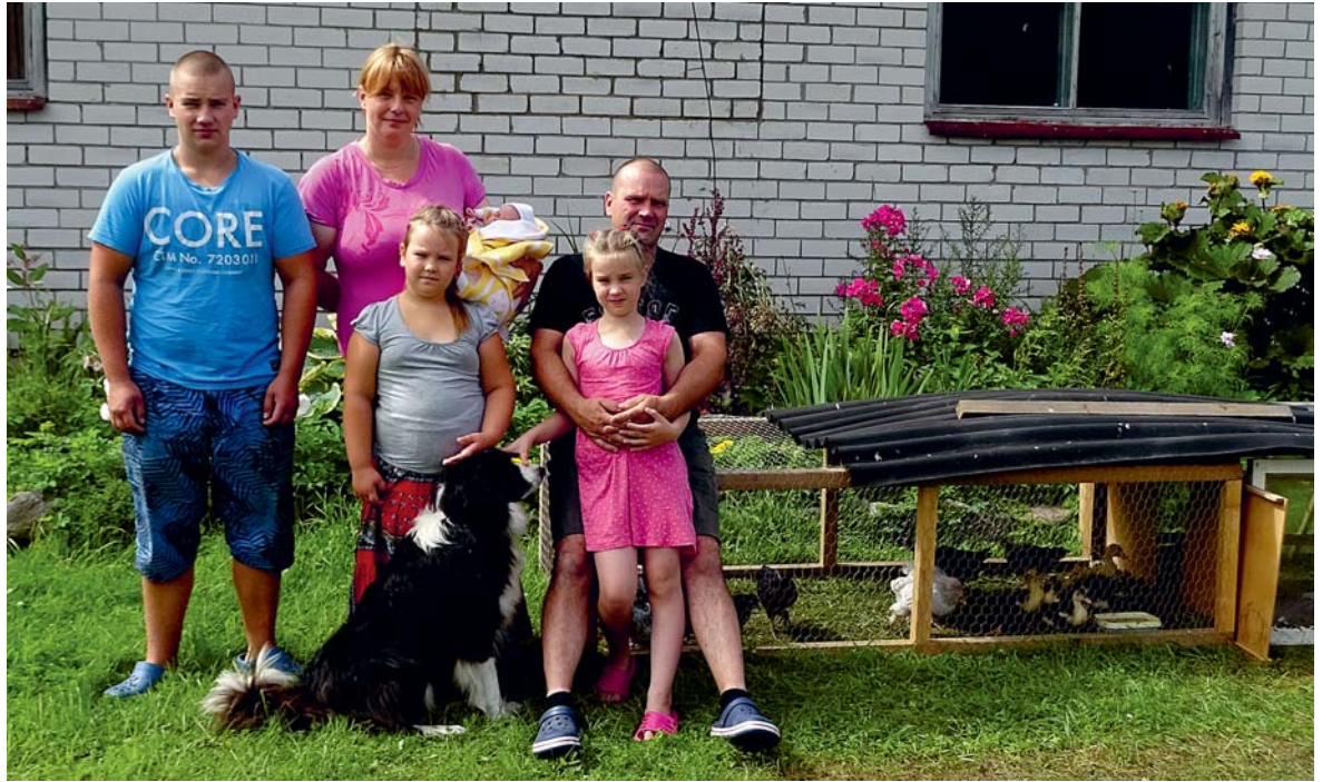
Perepilt koduhoovis. Autor: Malle Hokkonen