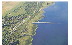
Rumpo rand Fotokonkurss «Avasilmi Vormsi»