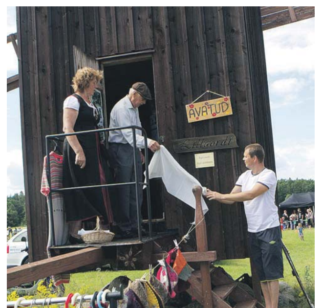
Nimetahvli avamine veskil.