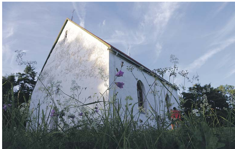
Õhus on Olavipäevade hingus