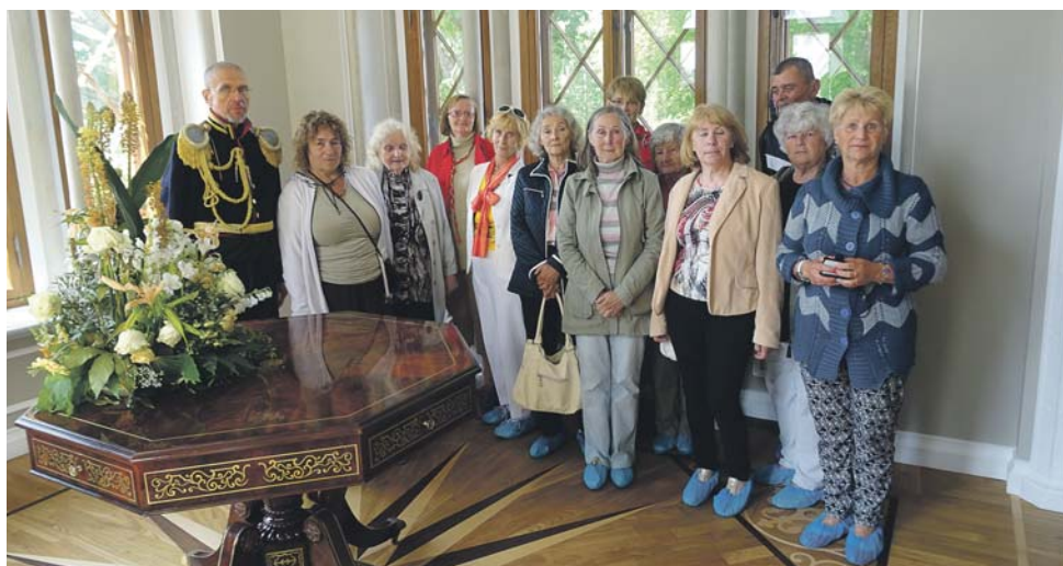
Uudishimulike seltskond koos vahva giidiga Keila-Joa mõisas.

Kogu see toredus, mis mahtus selle ühe ainukesse päeva sisse sai teoks «Vormsi pensionäride seltsingu» organisatsioonilise ja Vormsi vallavalitsuse toetusel.