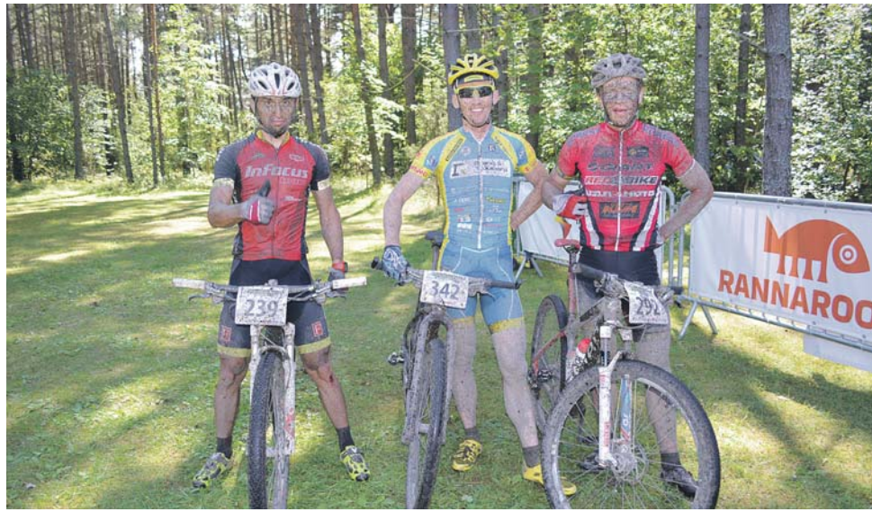
Porised, kuid õnnelikud võitjad.