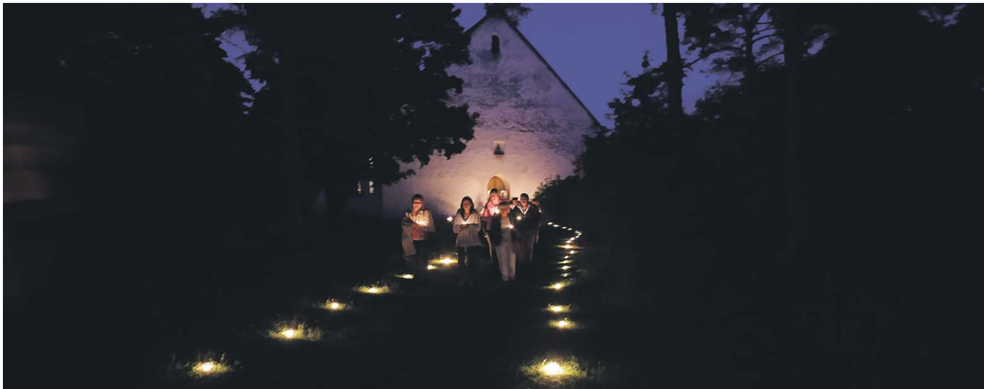
Hingematvalt ilus kesköömissa.