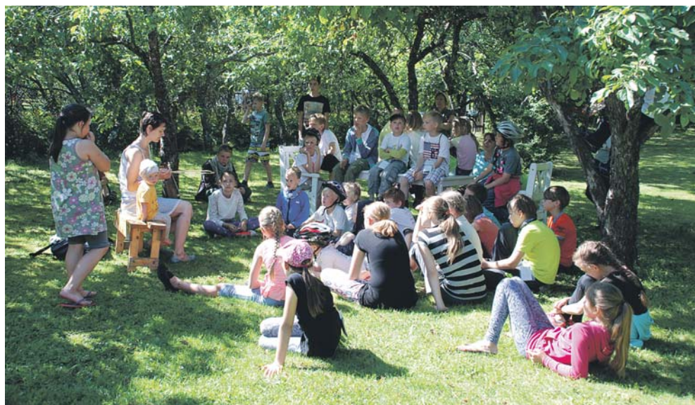
Muusikapäev Rumpos.

Meenutusi vahendas Jana Kokk, kasvataja ja üks paljudest korraldajatest.