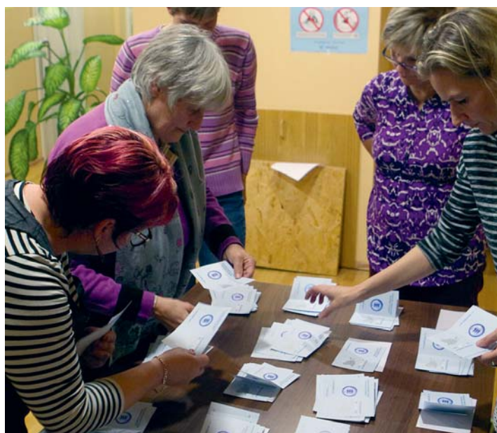
Valimiskomisjon hääli kokku lugemas.