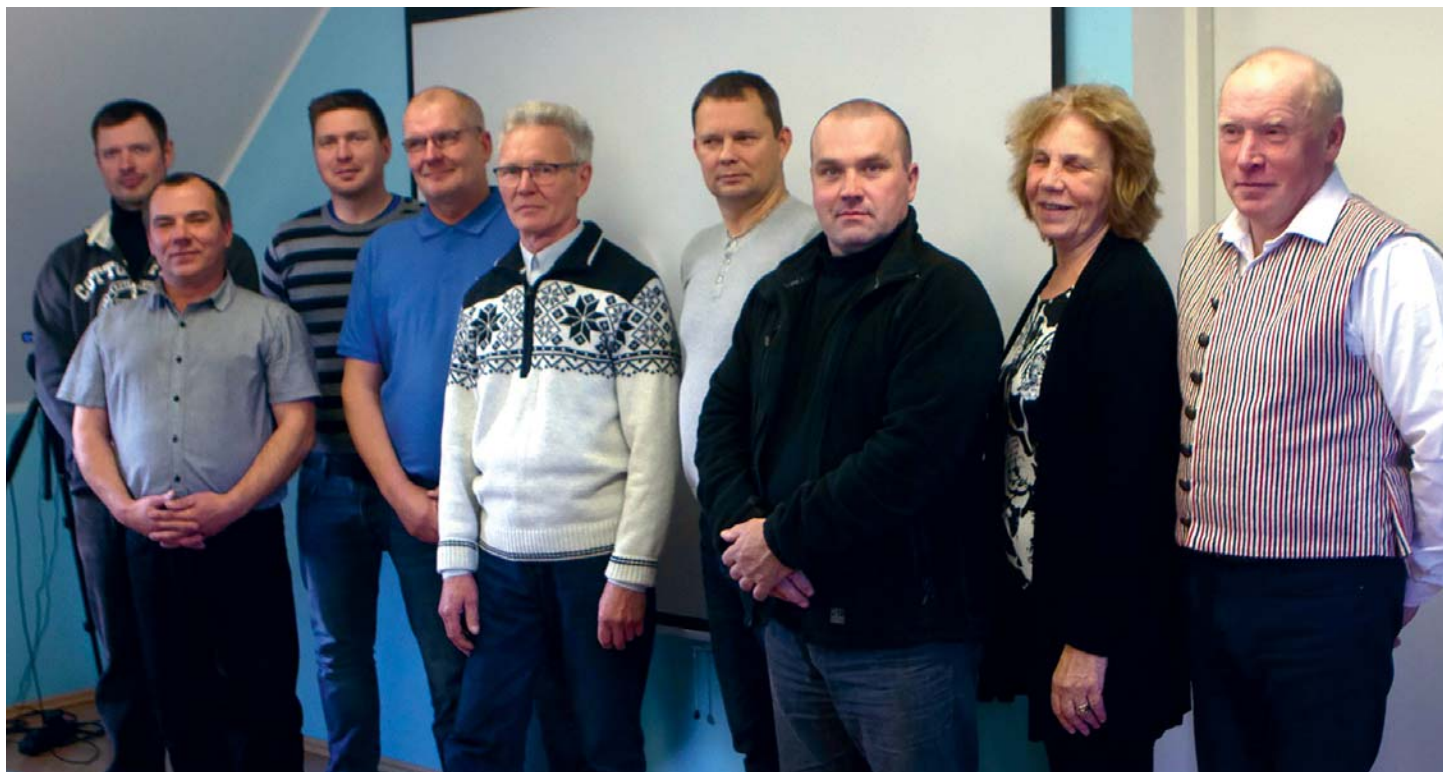
Äsja valitud Vormsi vallavolikogu pidas 23. oktoobril esimest istungit.