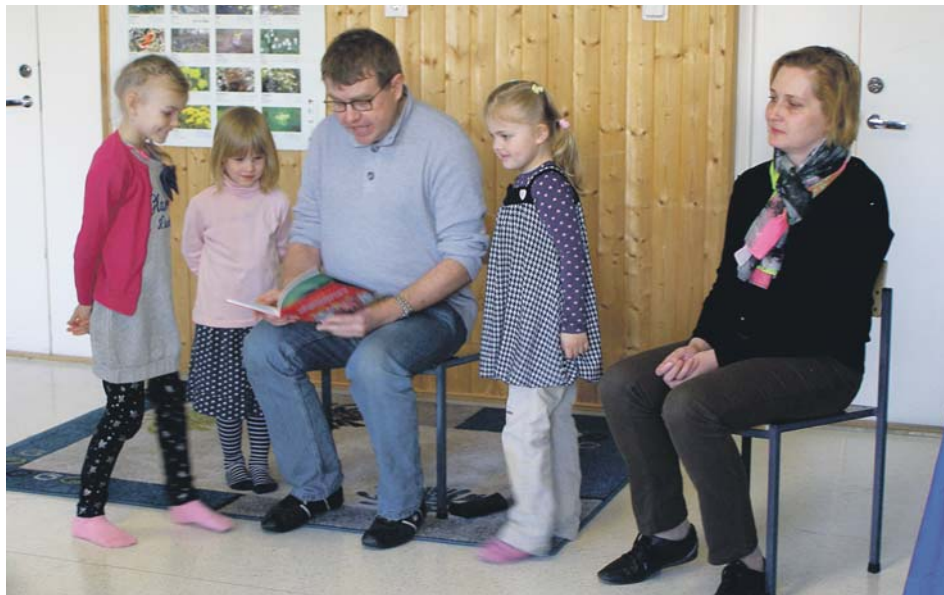
Mõnus lugemishetk koos kirjanikuga.

Tuntü huvi selle kohta, kuskohast tulevad kirjaniku huvitavad ja tabavad ütlemised ajakirjanduses – kirjaniku sõnul ikka päevakajalistest artiklitest ja teemadest. Arutleti muudegi põnevate lugemise-kirjutamise teemadega üle.