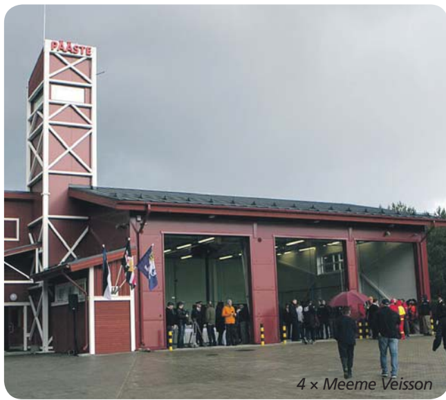
4 x Meeme Veisson

Refereeritud Tarmo Õuema artiklit Läänlasest