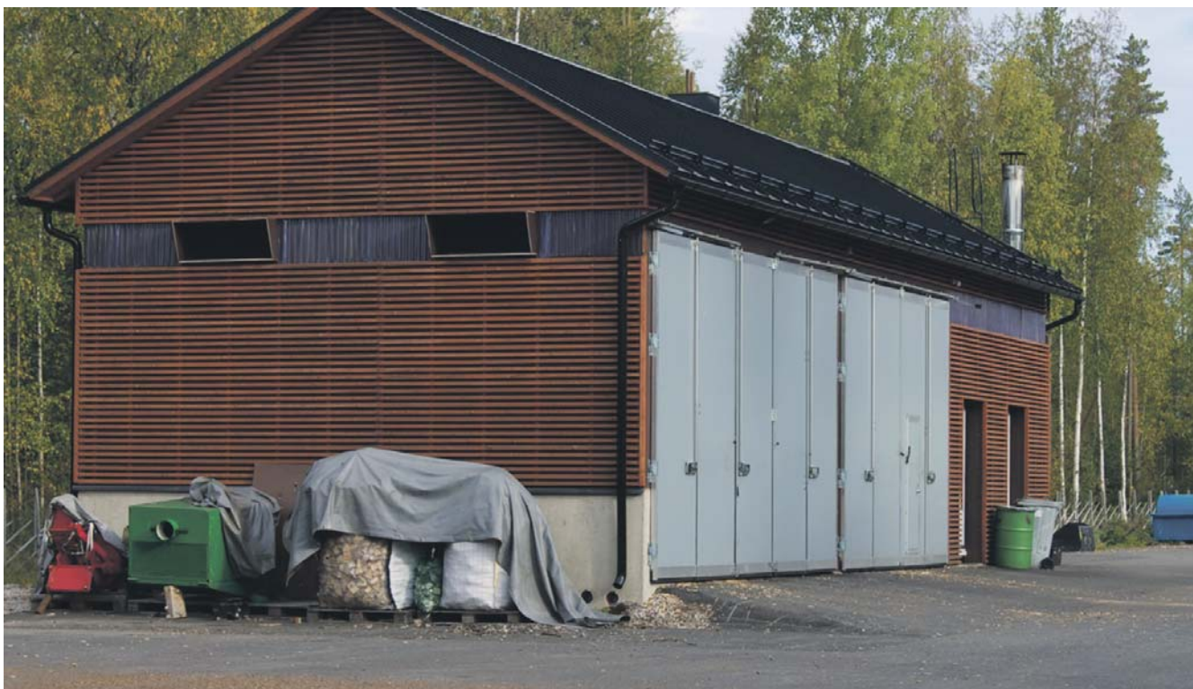
Koostootmisjaam Soomes, Kempeles.

Loomulikult jääme me ilmselt kasutama plastist korpussega telefone jms, aga suures plaanis võiksime püüda jõuda sarnaselt Samsö'ga toota oma vajamineva energia tuult, päikest või biomassi kasutades ise. Samsö toodab täna 140% vajaminevast energiast ise, ülejääk müüakse ja teenitakse sellega tagasi investeering ning ka kasumit.