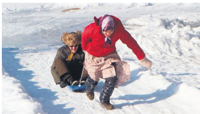
Parima kostüümi ja efektsete etteastete eest sai auhinna võistkond Eite-Taati.