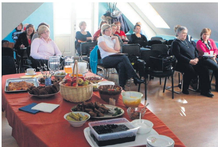
Laul oli pödravorsti, seenesalatit, kodus küpsetatud leiba jne. Kõik vormsilaste sohvritest.

Vanasõna ütleb, et vana kaevu ei aeta enne kinni kui uus on valmis. See reegel kehtib ka energeetikas. Eesti Elektritööstuse Liit toetab taastuvenergia kasutamise laiendamist, kuid mõistlikult — asendades põlevkivi kasutamise ilma varustuskindlust ohustamata ning ulatuses, mida ühiskond suudab kinni maksta. Kui odava taastuvenergia potentsiaal on ammendatud, siis tuleb kasutada kallimaid lahendusi — mitte aga vastupidi.