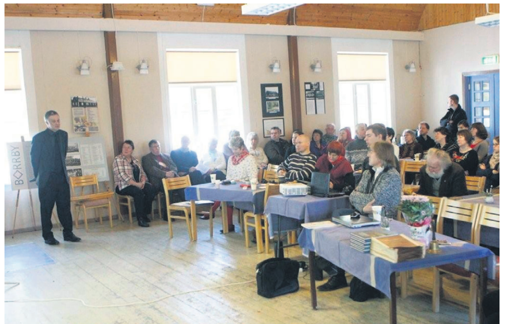
Kultuuripäeval sai kuulata huvitavaid sõnavõtte.

Esimene taoline laulupidu toimus 1933. aastal Cyrillus Kreegi juhtimisel. Põnev oli kuulata lugusid saare hari-