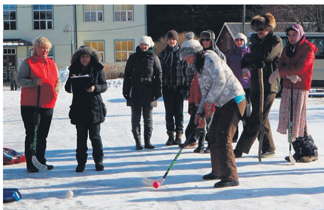
Täpsusvise saalihoki palliga Hullos prügimajja.