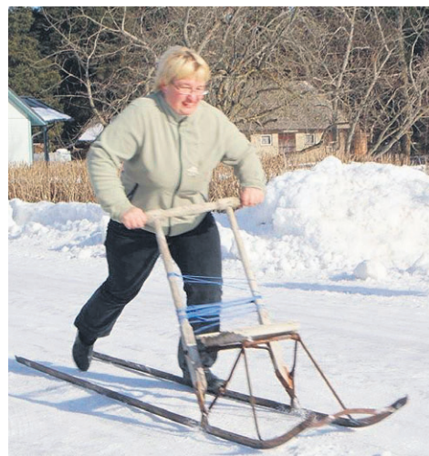
Vapper soome-kelgu-sprint.

Balticule ja perekond Allikule, kes jääraja sponsorkorras valmistas. Rada sai nii hea, et sõitjaid jätkus pärast võistluste lõppu. Rõõmu valmistas eriti see, et päris palju lapsi võttis mängudest osa ja nii mõnigi vanem jäi oma järeldasvule kiiruses ja osavuses alla.